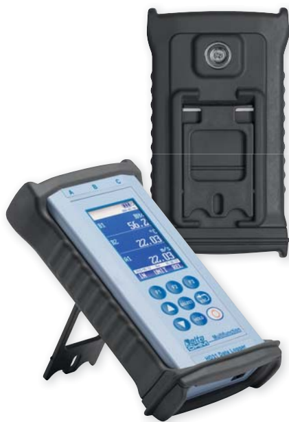
ochranné pouzdro z tvrdé gumy (55 SHORE) se stojánkem a magnetem pro použití v náročných podmínkách

SWD05 stabilizovaný zdroj, 100 ... 240 V AC, 5 V DC, 1 A, výstupní konektor USB typu A